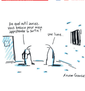
La réinsertion des personnes détenues : l'affaire de tous et toutes Antoine Dulin