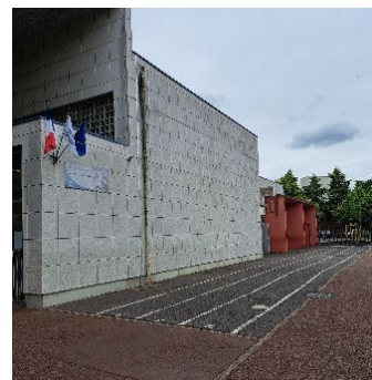
Couloirs d'athlétisme dans la cour de l'école Maurice Genevoix (Évry)