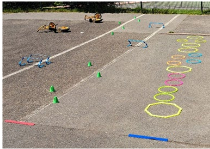
Utilisation du kit lors de la récréation à Dangy

À l'inverse, les enseignants de l'école primaire de Dangy dans la Manche ont souligné l'effet positif de proposer aux élèves des ateliers dynamiques pendant la récréation : ils facilitent le mélange des groupes d'élèves et la participation d'élèves seuls.