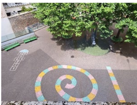
Cour maternelle de l'école Chomel (Paris)

Les rapporteurs ont pu constater lors de leurs déplacements l'importance du marquage dynamique dans les cours de récréation (marelle, couloirs d'athlétisme, cercles ...) pour inciter les enfants à se dépenser.